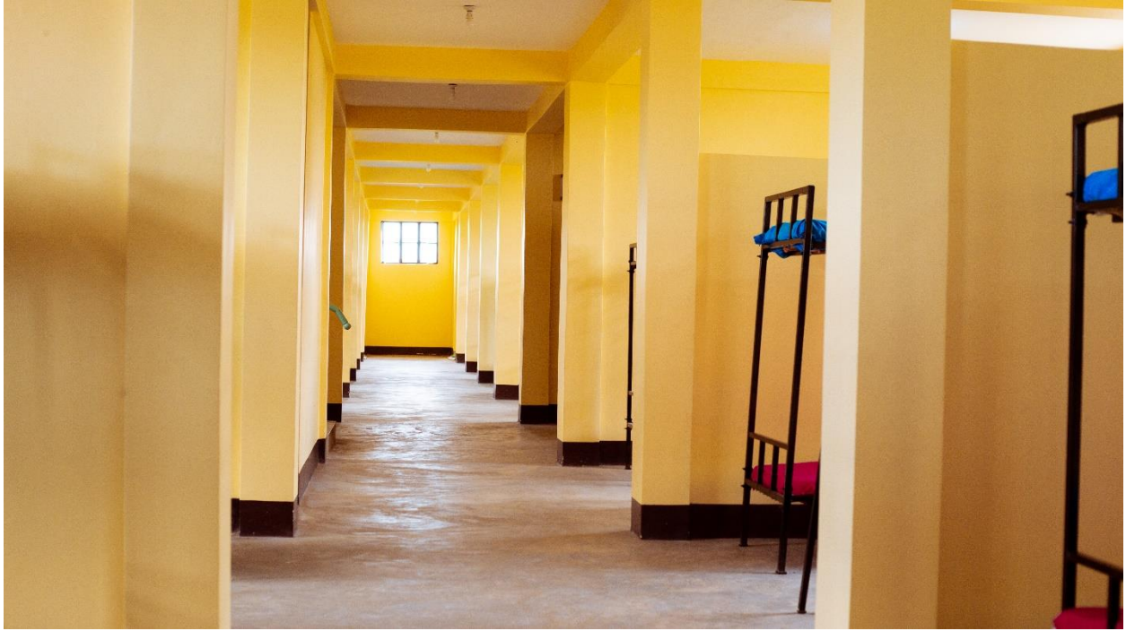
Muonekano wa ndani wa mabweni ya wanafunzi, Msakila s.s