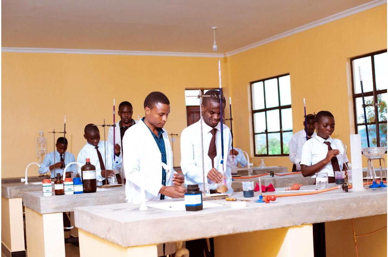
Wanafunzi wakiwa katika maabara za shule, Msakila s.s