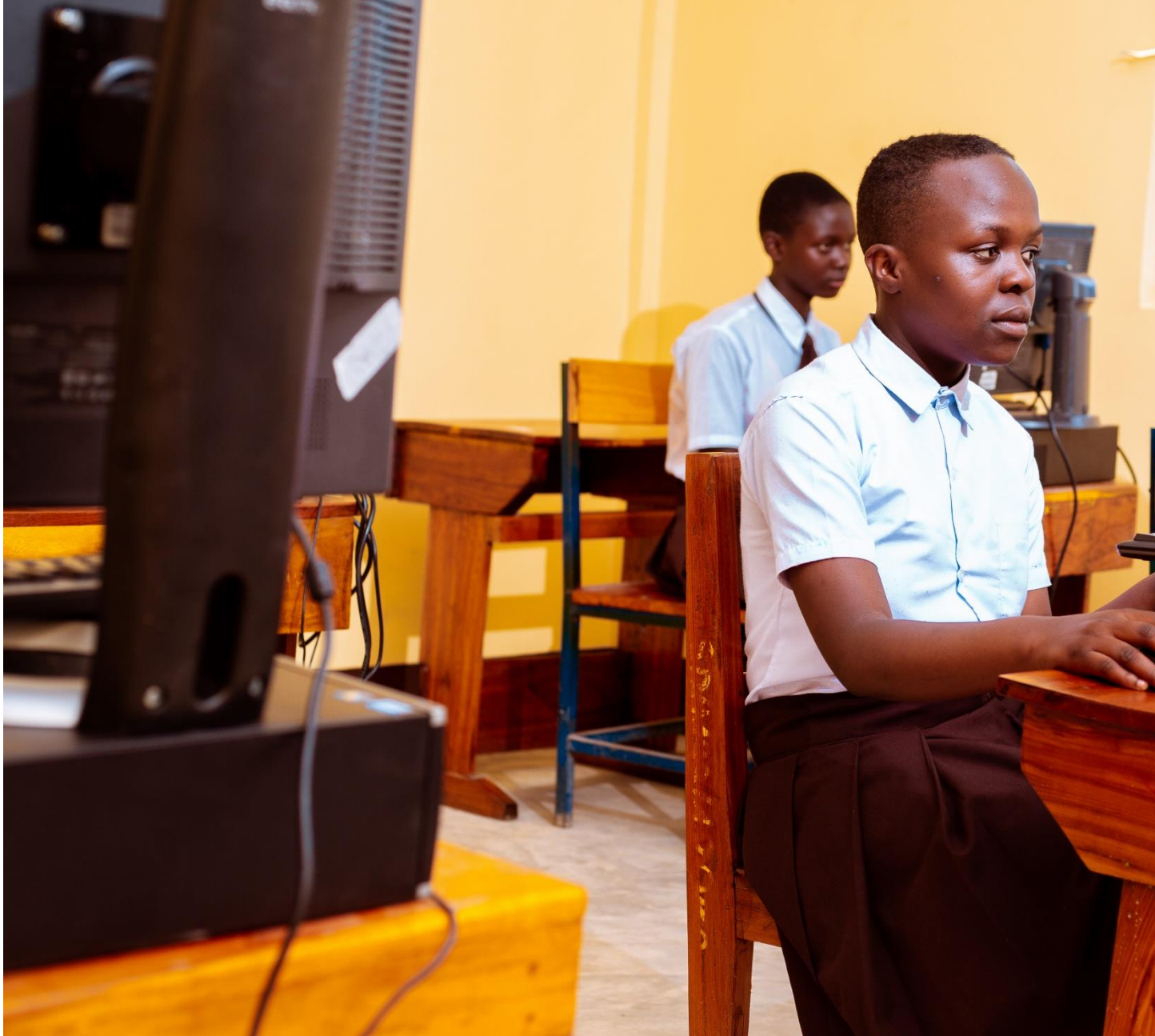
Wanafunzi wakiwa katika maabara ya kompyuta, Msakila s.s