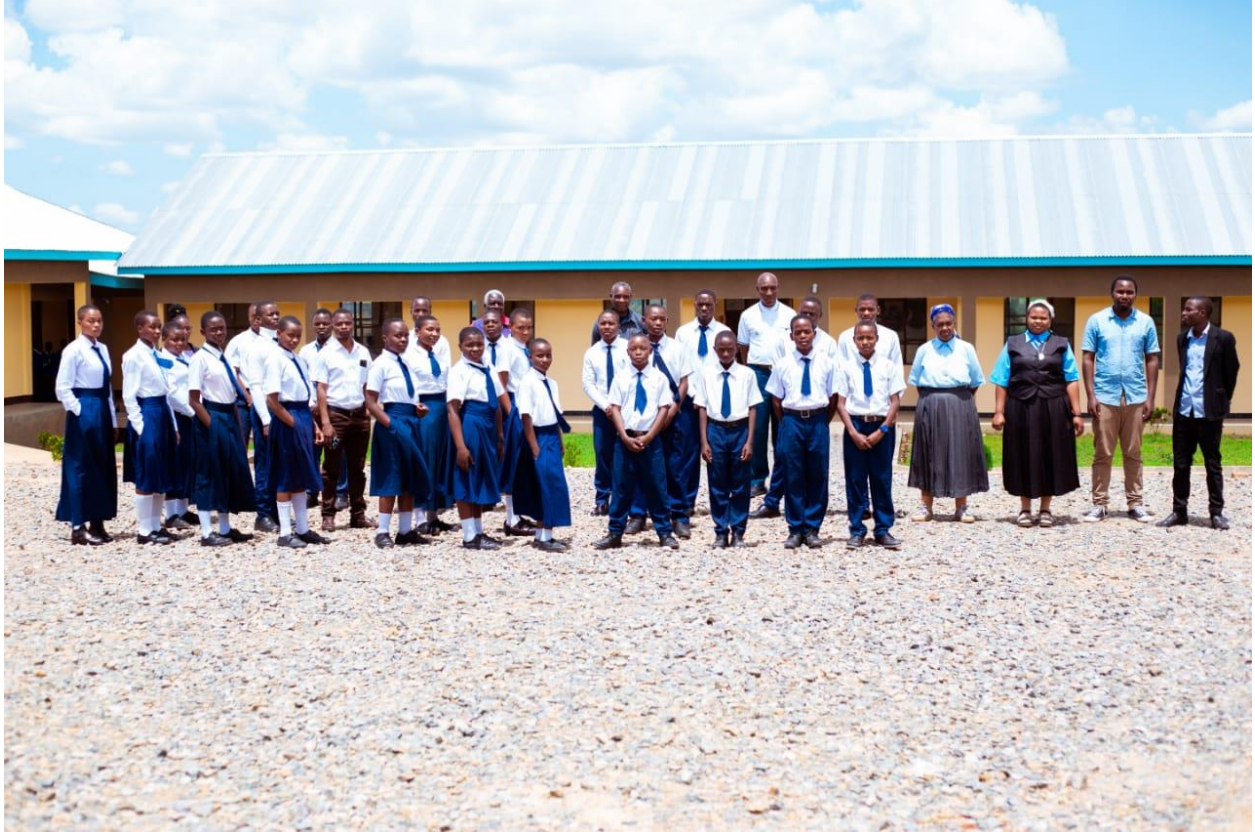
Baadhi ya walimu na wanafunzi wa Shule ya sekondari Msakila katika picha ya Pamoja