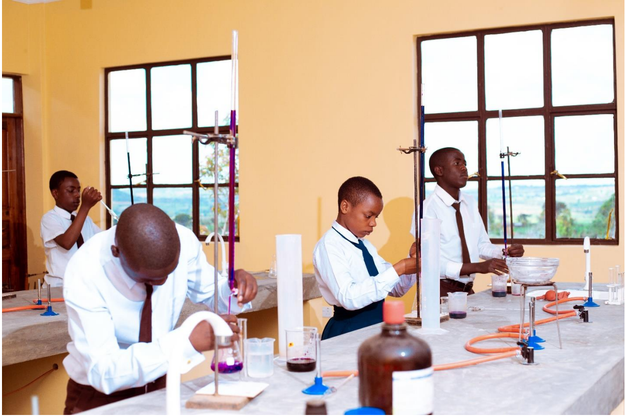
Wanafunzi wakiwa katika maabara za shule, Msakila s.s