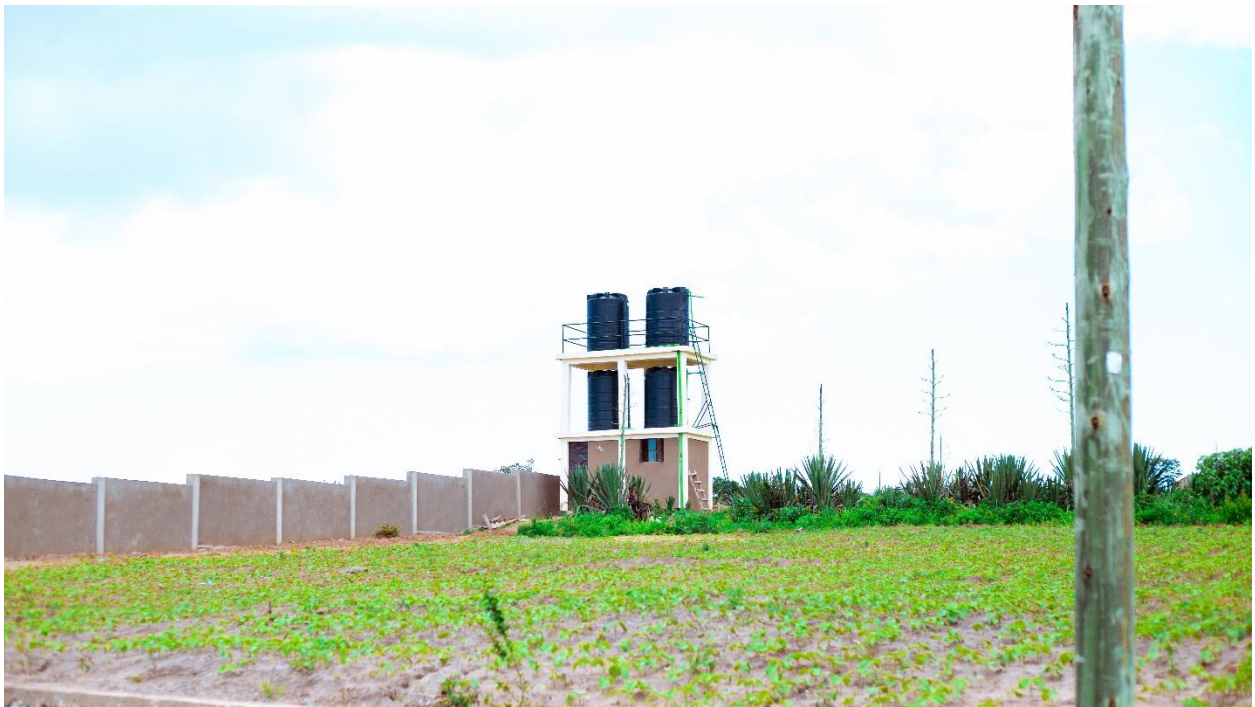
Matanki ya kuhifadhi maji safi na salama ya shule, Msakila s.s