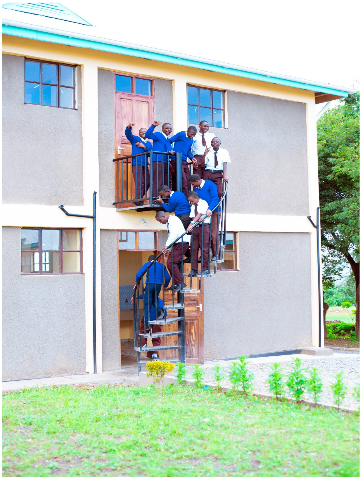
Muonekano wa nje wa mabweni ya wavulana, Msakila s.s