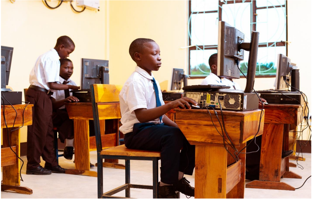
Wanafunzi wakiwa katika maabara ya kompyuta, Msakila s.s