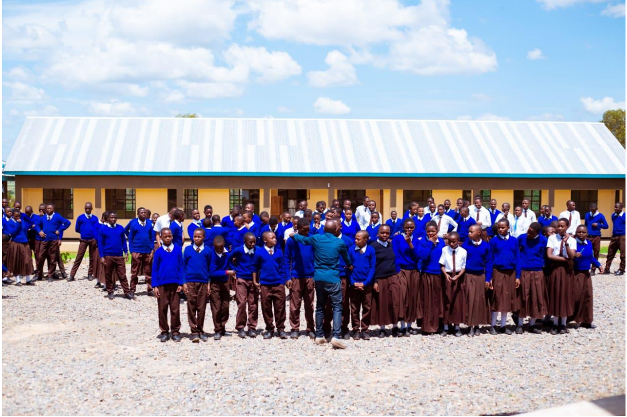
Wanafunzi wa Msakila Sekondari