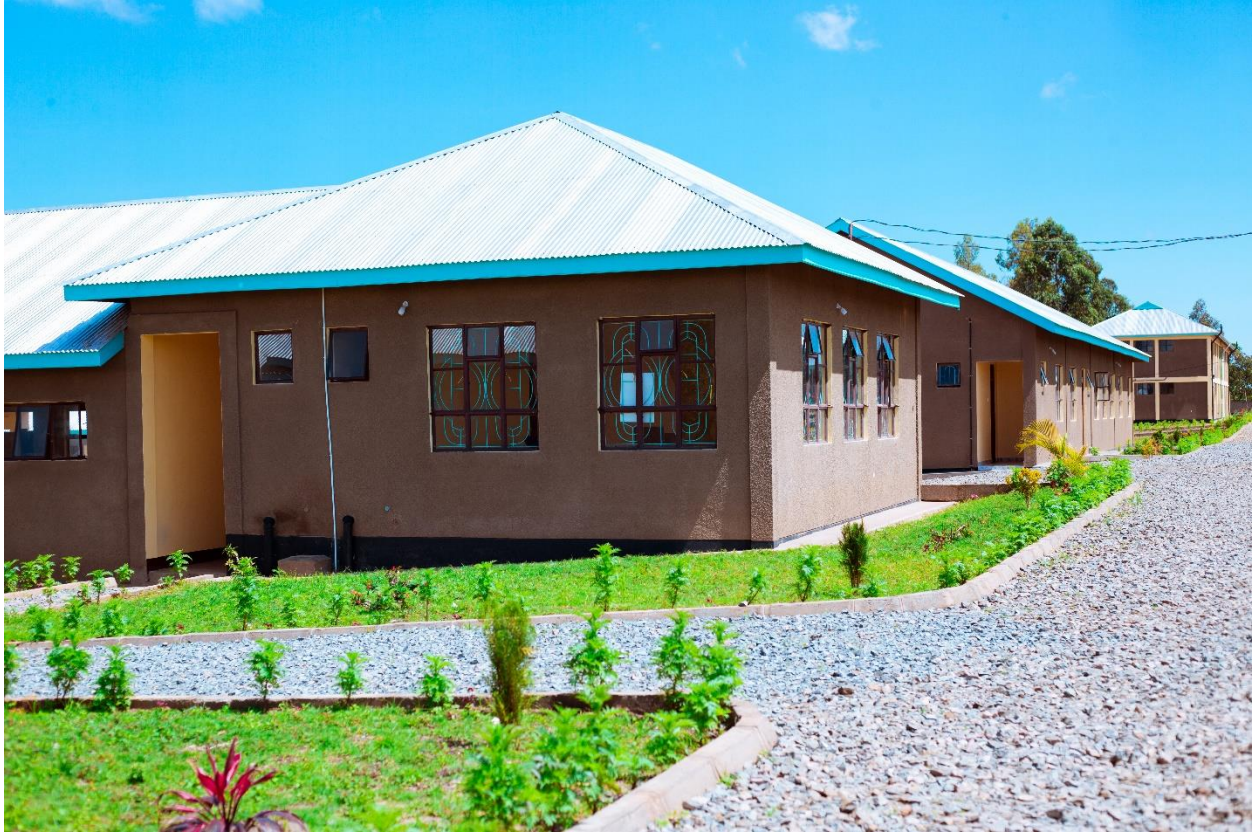
Muonekano wa mazingira ya shule kwa nje, Msakula s.s