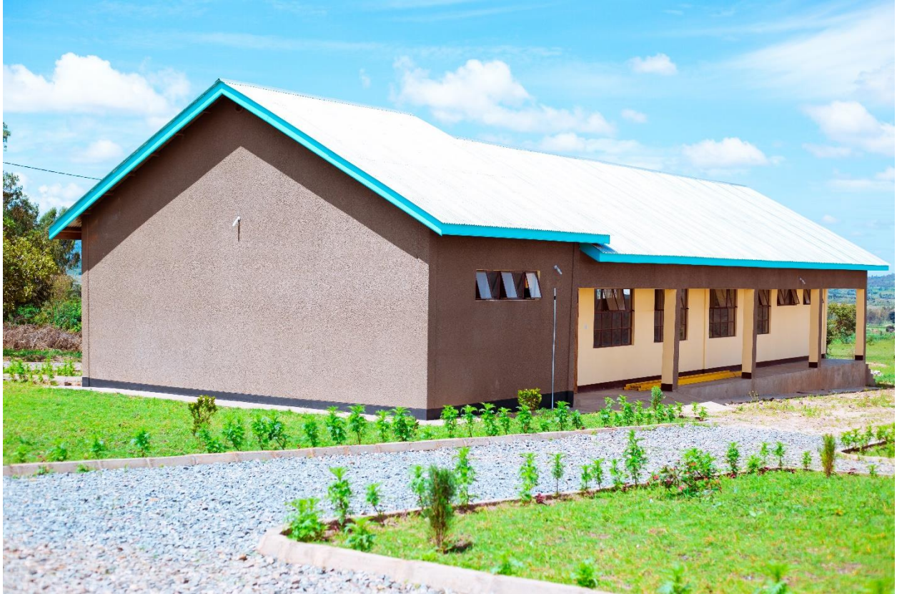
Muonekano wa maktaba ya shule, Msakila s.s